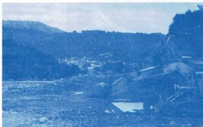
Panorama exceptionnel ouvert sur la ville après les rectifications de la route de Champs

Une entreprise locale a engagé dès le 25 Septembre les premiers travaux destinés à rectifier le virage de la carrière route de champs. Cet aménagement très attendu apportera une amélioration incontestable sur cette départementale BORT-CHAMPS. À noter par ailleurs que les derniers et très importants travaux prévus aux portes de MAURIAC se sont terminés début septembre créant ainsi sur la jonction MAURIAC-BORT un itinéraire pratiquement totalement différent de celui emprunté encore voici 20 ans.