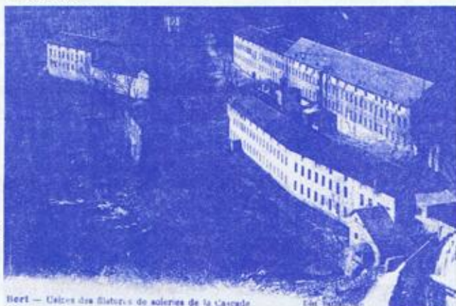
Bort - Vue des bâtiments de soierie de la Cascade

En réalité, la première usine de la cascade de la Rhue, construite fin 1856 démarra effectivement le 15 Mai 1857. L'énergie hydraulique produite par un barrage de sept mètres de haut (démoli en 1904) naissait grâce à un petit canal actionnant une grande roue de bois fonctionnant jusqu'en 1910. Deux turbines de 250 et 100 CV installées en 1902 et 1910 fournissaient la puissance énergétique nécessaire aux installations industrielles.